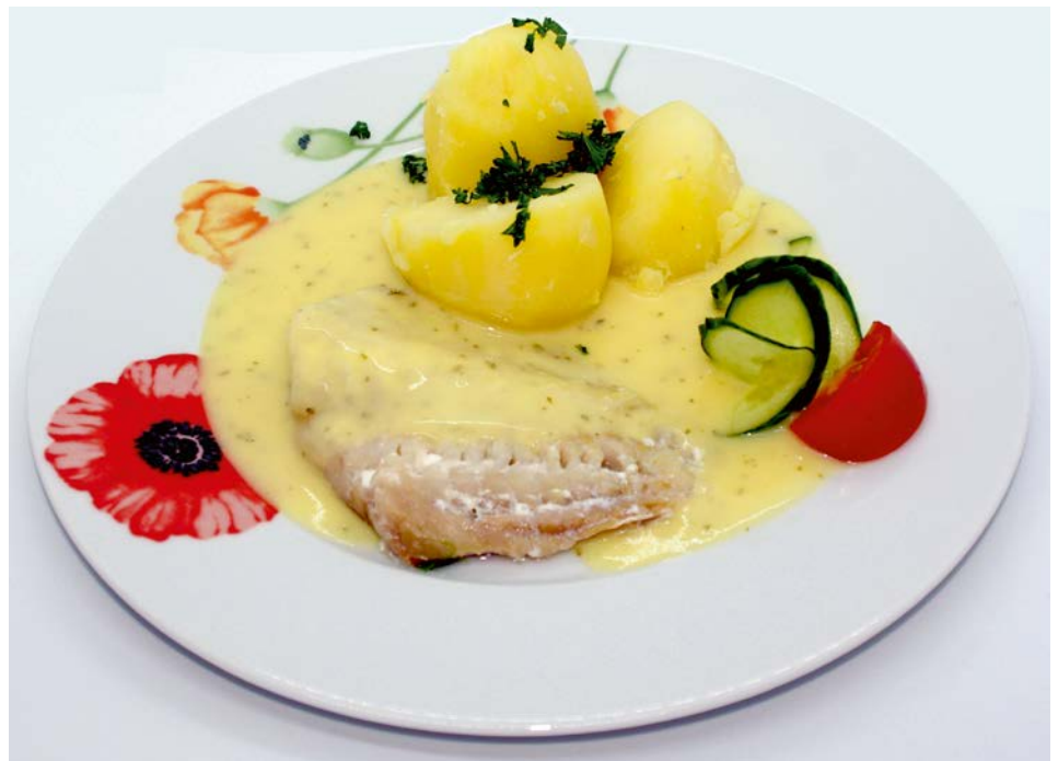
Fischfilet mit Zitronensoße

Der Menüservice der DRK Saale-Orla Service GmbH versorgt mit seinen insgesamt drei Küchen neben dem Angebot „Essen auf Rädern“ die Bewohner unserer drei Pflegeheime sowie sieben Kindergärten vom Deutschen Roten Kreuz und anderen Trägern im Landkreis. Einige Kunden bestellen sich unsern Menüservice wochentags an ihren Arbeitsplatz. So haben Sie täglich eine abwechslungsreiches warmes Mittagessen.